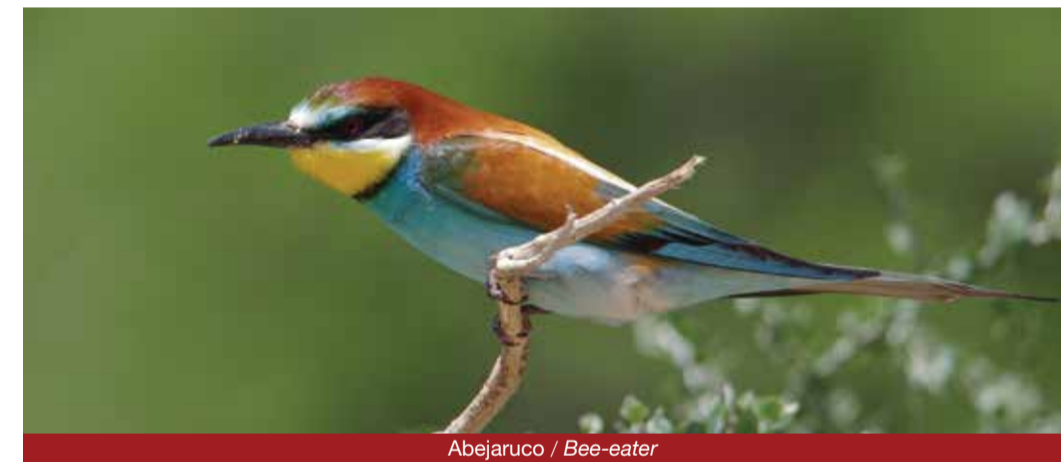
Abejaruco / Bee-eater

Entre la fauna, son protagonistas las aves, siendo frecuentes especies como oropéndolas, rabílargos, abejarucos y curruca tomillera, además de diversas rapaces, como los majestuosos buitres leonados o águilas reales, hasta los esquivos azores y gavilanes, más difíciles de ver. El embalse de El Atazar atrae a su vez a aves acuáticas. Los reptiles y los anfibios resultan también de interés, como el lagarto ocelado, el tritón jaspeado y el sapo corredor, entre otros.