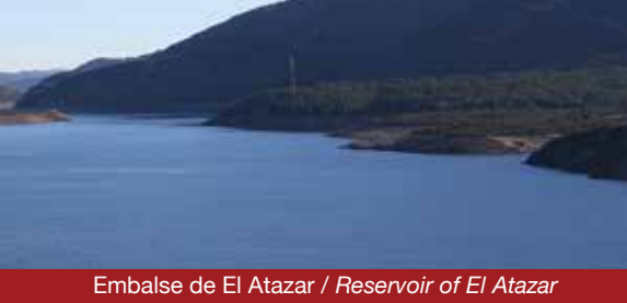
Embalse de El Atazar / Reservoir of El Atazar