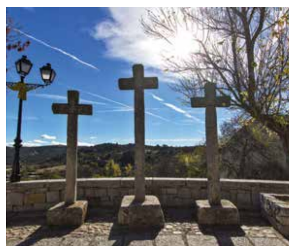
Crucero de la iglesia / Crosspiece of the church

Reservoir of El Atazar. Our territory is deeply marked by water: by the river and, especially by the reservoir of El Atazar.