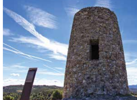
La Atalaya / The Watchtower