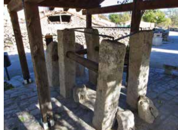
Potro de Herrar / Place to shoe