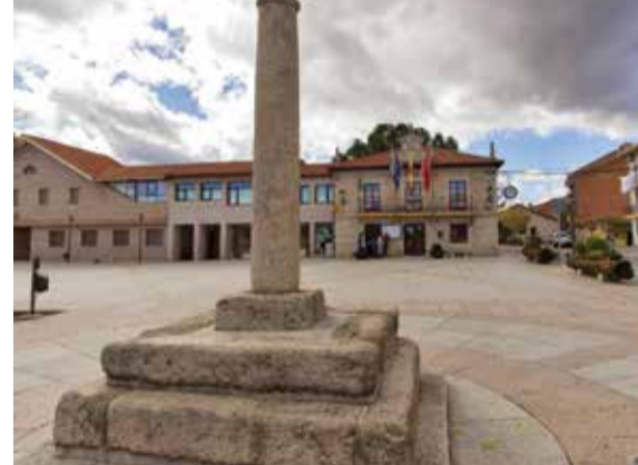
Picota o Rollo / Pillory