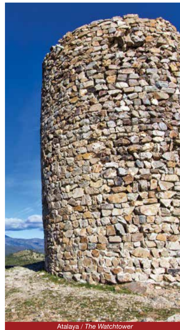
Atalaya / The Watchtower

In our landscape it remains the imprint of centuries of history: from Roman times, as a way of communication (Roman bridge), to Medieval times, with Arab domination and the Reconquest, forming part of the Defensive Middle Mark and the later Christian colonization through extensive cattle farms.