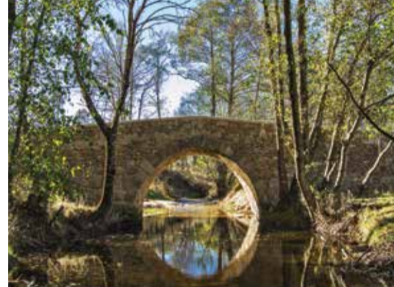
Puente Romano / Roman bridge