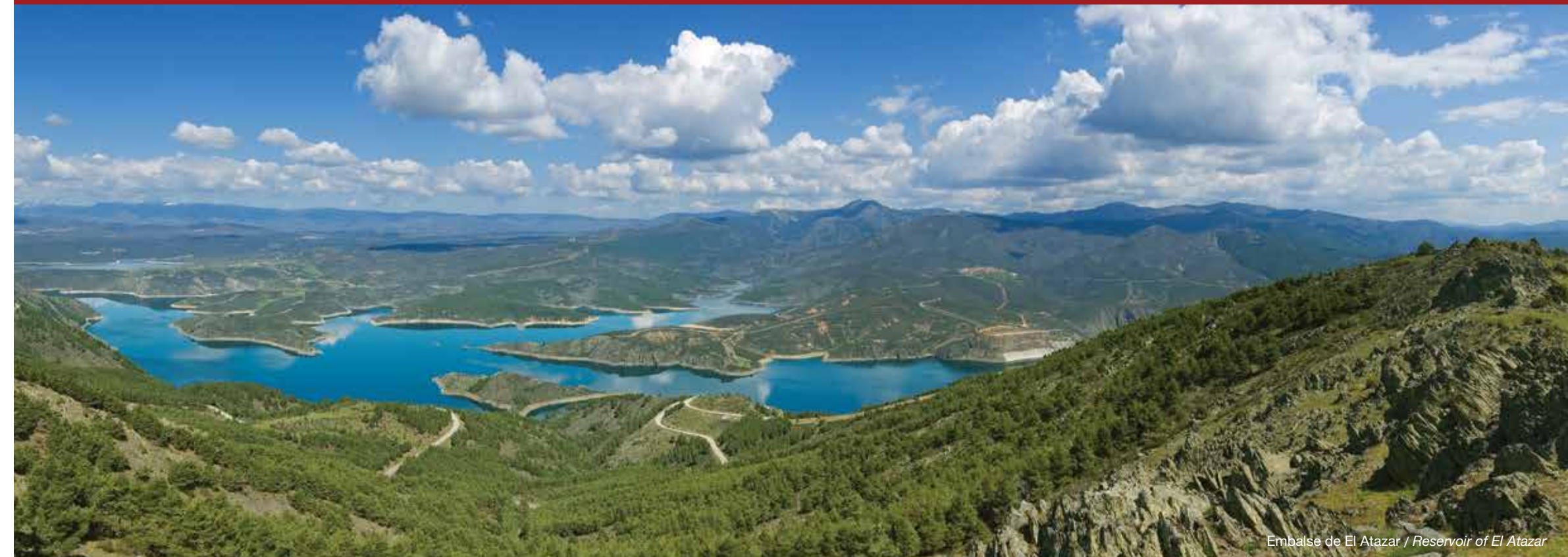
Embalse de El Atazar / Reservoir of El Atazar