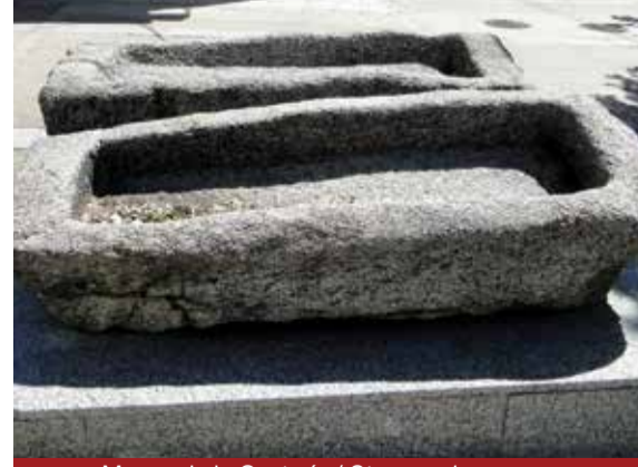
Museo de la Cantería / Stonework museum